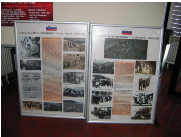
Postavitev panojev v Sežani

Postavitev je prikazana na naslednji sliki.