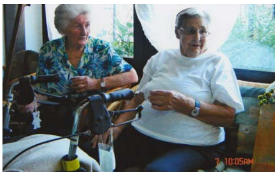
Obiskali smo Mali Roziko za njen 88 rojstni dan